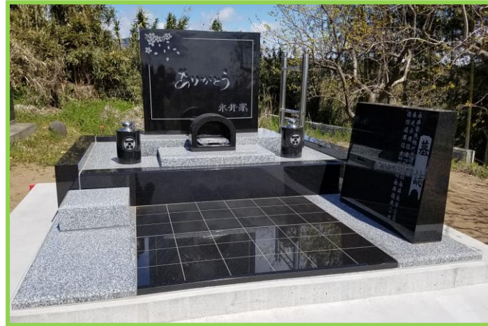
文字や形にこだわったデザイン墓。来た人に「ありがとう」のポストカードを届けるようにと思いを込めて。