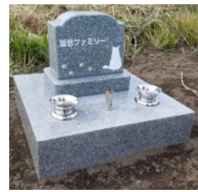
ネコちゃんのお墓

ペットは家族の一員です。長年、一緒に生活していると、当たり前になったり、生活に共にいます。お客様は、生活を共にしたネコちゃんのお墓を作って供養したいとご来社されました。家族全員がネコちゃんを可愛がっており、人生の節目の時や落ち込んでいる時など、気持ち