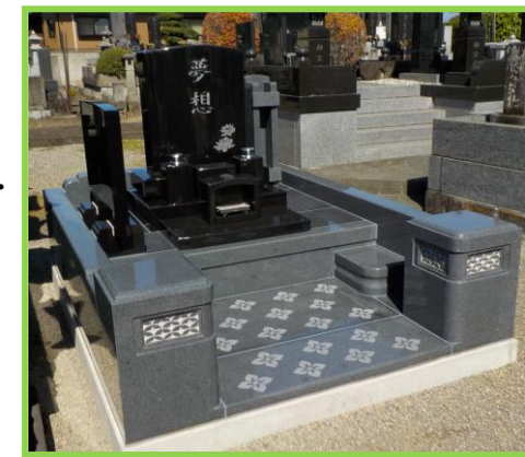
寿陵墓です。家族代々で使える調和のとれたデザインです。