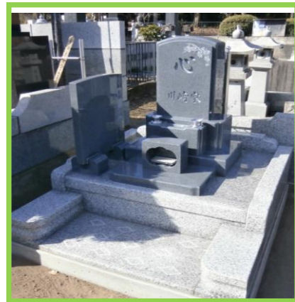
「心」を込めてお墓参り。亡き人に逢いに来ます。

見えない所にこそ気を配り、安心の自社施工。耐震工法で丁寧に仕上げております。 一級技能士 丸山工事部長