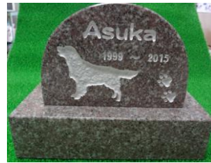
ワンちゃんのお墓

和らぎとても癒されて助けられたと語ってくれました。ペットのお墓を作る方は、一緒に生きてきた証を残したいとの想いがあり、お墓を建て、名前を刻み、ずっと忘れる事なく供養されます。中里では、ペットのお墓を建てるお手伝いを承っております。