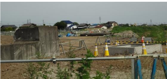
北側前橋安中富岡線からの工事の様子