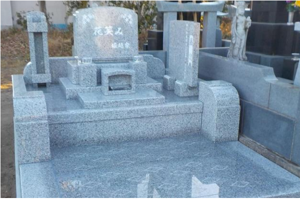
優しい色合いの白御影石を全体に使用。外柵で全てを覆わず、広々とした印象に。