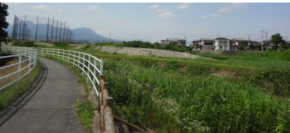
公園弓道場辺りからの様子。こちら側はまだ工事の様子は見えません。