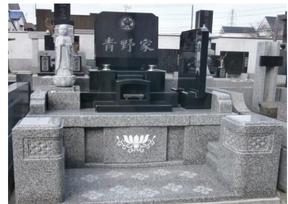
立ったままお参りしやすい、岡カロート式。