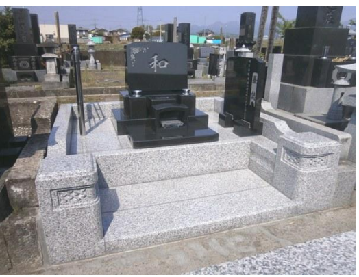
家族が平和に暮らせるよう「和」と刻みました。