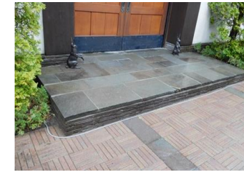
玄関小端石積・石貼