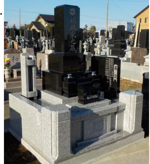
伝統ある和型墓石。限られた敷地を有効に利用。