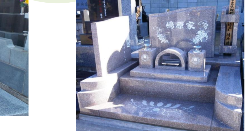
建立時のバランスを考えながら、花模様を配置。生花が加わると一層華やかに。