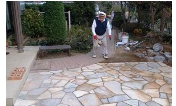
個人邸 石乱貼り工事

トイレットペーパーの切り口が見つかからない。先が中々つかめずにくるくる回した経験はありませんか？一枚もので硬く巻かれたペーパーは、意外と手こずります。何気なく始めたトイレットペーパー三角折り。不思議な事に何事にも飽きつぽい性格の私、年齢のお蔭でしょうか？この動作が習慣になりました。無料でトイレが使用でき、ペーパーも使わせて頂ける環境に感謝を込めて折ります。二列に並んだペーパーも、右に左に折って、おりがとう！