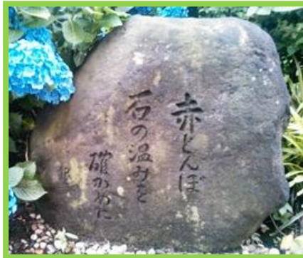
「食亭つかさ」店舗前の句碑