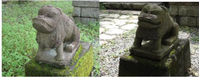
愛嬌のある独特な顔 寛保3年(1743)に彫られた物。悔しそうな顔?にも見えます。 日光市足尾駅付近