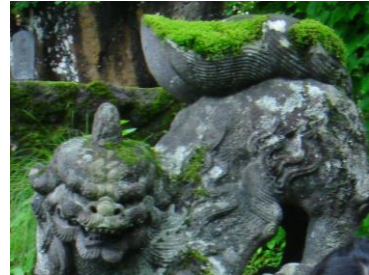
睨みが鋭い! 戸隠神社 奥ノ院前