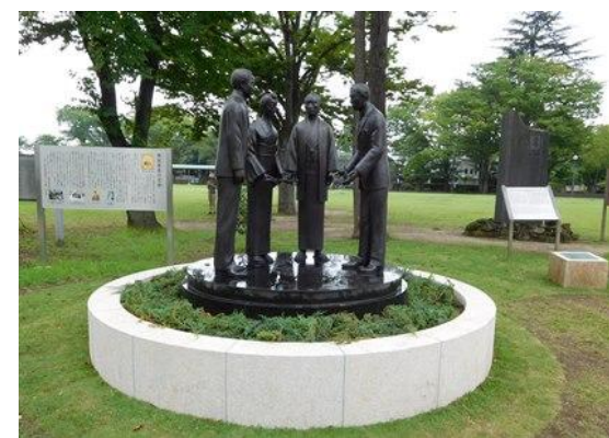
ブロンズ像の台座石