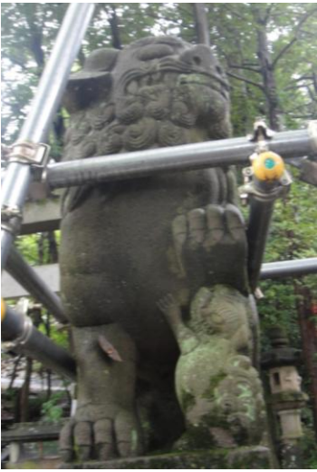
足元に子犬?微笑ましくもあり、恐ろしくもあり? 愛知県 犬山城登城入口 三光稲荷神社境内