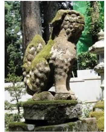
台座の石が円形に 鳥取県三徳山 宝物殿

てほとんど獅子像になり、角を持たない像も多くなりました。また、足元に「玉」や「子犬」を置くなど様々なカタチの狛犬も出現しています。玉を置いた像を「玉取りの狛犬」、子犬を置いた像を「子取りの狛犬」と呼び、通常は阿形が玉を、吽形が子犬を足元に置いています。阿形も吽形も「両方とも玉を足元に置いているバージョン」や「吽形だけ玉を持つているバージョン」なども存在します。しかし、様式が簡略化され、左右ともに角がないものが多くなっています。