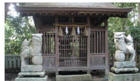
両方の足元に玉があります。三朝温泉付近の散歩途中で見つけました