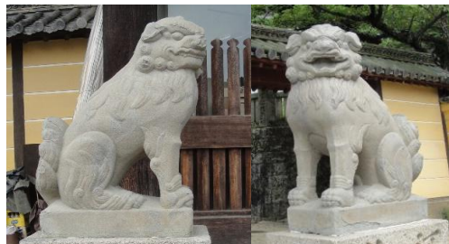
「あ・うん」がはっきりとした口元。こんぴらさんには 狛犬が数々寄進されています。備前焼のものもあります。香川県 金刀比羅宮

『いざ、お墓を考えると解らない事ばかりです。』 お墓のこと どうしたらよいかお悩みの方。まずはご相談を