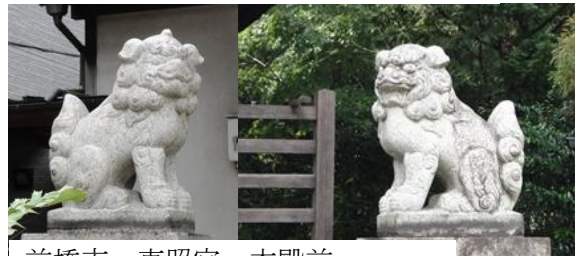
前橋市 東照宮 本殿前