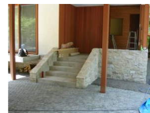
玄関アプローチの乱貼り