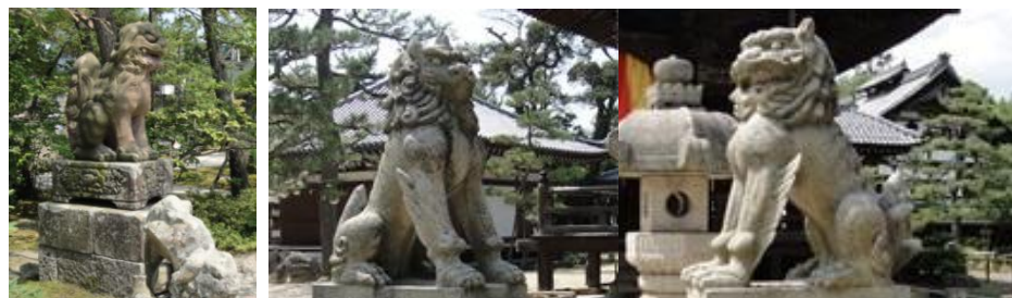
境内には様々な形をした獅子らしき物や狛犬が寄進されています。天橋山知恩寺(名勝天の橋立) 宮津市