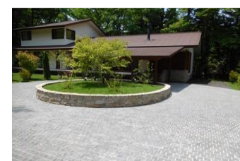
庭園・広場を御影石のピンコロ貼り

子供の手形 福ふくろう 愛猫を石彫刻に 歌碑や記念碑のオススメ 俳句・川柳・辞世の句等石に刻んで、庭やお墓に残しませんか。